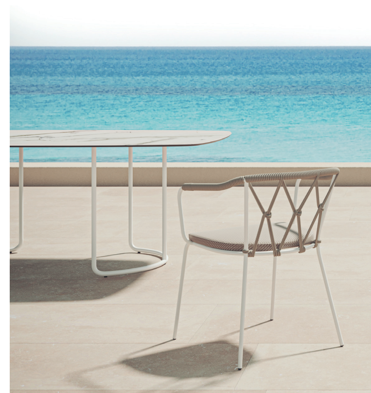
Tavolo Scala da esterni

Una collezione di tavoli in cui un top coordinato o a contrasto poggia su una struttura estremamente leggera ma robusta. Le linee curve della base permettono di utilizzarla sia per tavoli rotondi che rettangolari con un effetto pulito ed elegante. Il tavolo della collezione Scala Outdoor ha una struttura in metallo verniciato antracite, bianco e sabbia che si completa con piano rotondo diam. 120 e 140 o rettangolare con angoli raggiati nelle dimensioni: 160x110 e 200x110. I top sono realizzati HPL SP 10 nei colori standard e nelle finiture calacatta bianco e lava opaco e lucido.