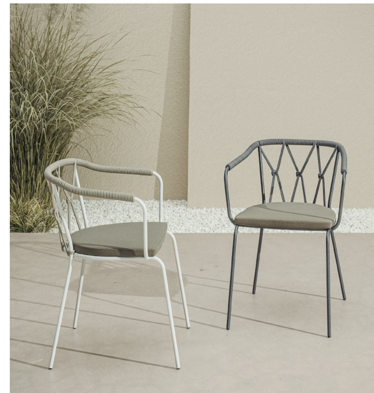
Poltroncina Scala da esterni

Funzionalità e leggerezza sono i valori che ritroviamo nella nuova proposta da esterni Scala Chair. Ispirandosi alla tradizione delle sedie con struttura in metallo e corda il designer Marco Piva progetta una seduta elegante e leggera, un'architettura sospesa di grande contemporaneità. La struttura in metallo è arricchita dal particolare schienale in corda realizzata con l'esclusivo nodo progettato da Alma Design. Le linee morbide dei braccioli la rendono estremamente pratica e confortevole.