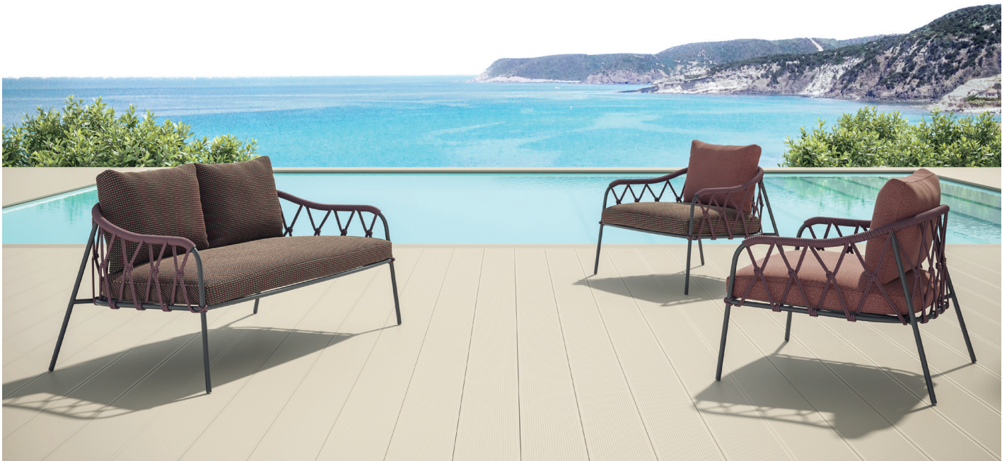
Divano e Poltrone