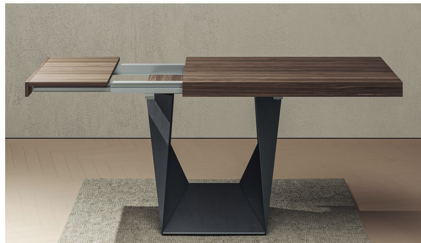
Tavolo Clint versione allungabile

Numerose le dimensioni disponibili per questo tavolo simbolo di Alma Design a cui si aggiunge la nuova versione allungabile 1400x900+500+500. I piani realizzati in impiallacciato noce canaletto SP50 sono disponibili in finitura noce, nero carbone e pietra.