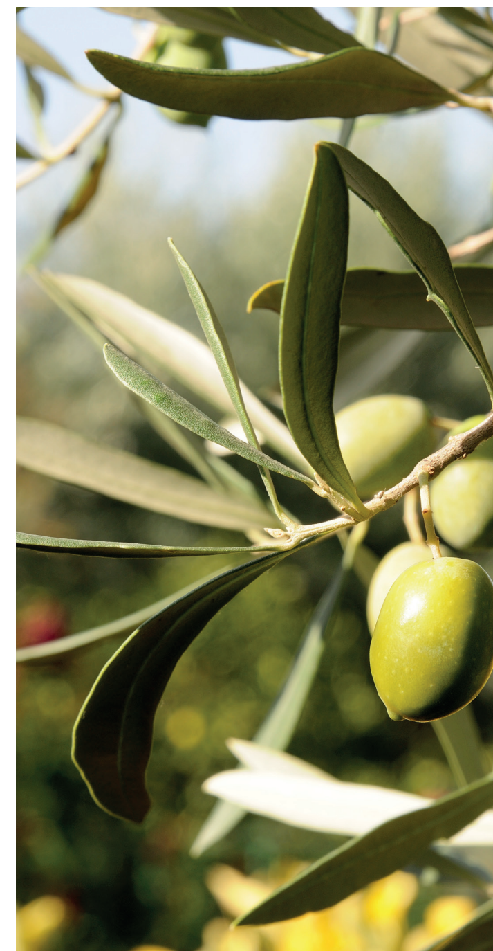
La concia naturale che nasce dall'estratto delle foglie di olivo

Questa nuova esclusiva finitura sarà disponibile su diversi modelli di Alma Design, tra cui poltrona e divano della collezione Scala da interni, poltrona e divano Big della X Collection e sulla nuova poltroncina Marta che verrà presentata nel 2023... una bella novità su cui non possiamo darvi anticipazioni.